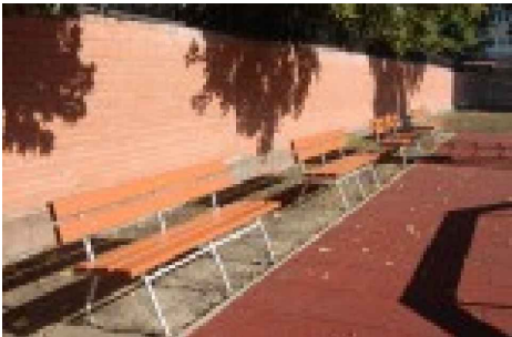
SOLIŅŠ AR ATZVELTNI