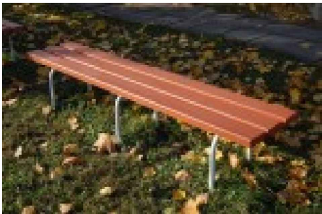
SOLIŅŠ BEZ ATZVELTNES